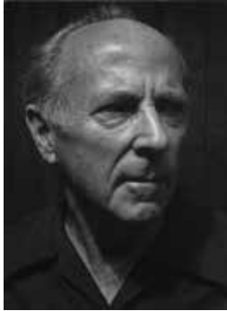
Ansel Adams Edward Weston , 1950s gelatin silver print 24 x 18,4 cm